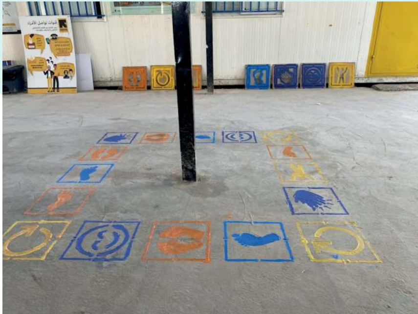
معروضة المسار الأرضي- مخيم الزعتري [كانون تاني، 2023]

هي مسار أرضي برموز مختلفة يمثل كل رمز حركة معيّنة كما هو موضح أدناه. يتنقل الطفل في المسار محاولاً تنفيذ ما يمثله الرمز بالإعتماد على مهاراته الحركية والمعرفية والبصرية. هذه المعروضة مناسبة لمناطق الانتظار الداخلية أو الخارجية . احرصوا على وضعها في مكان جيد الإضاءة وبالقرب من مكان انتظار الأهل في المركز الصحي.